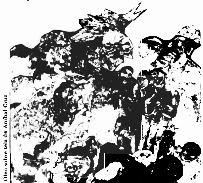
Oleo sobre tela de Aníbal Cruz

En la investigación sociolingüística, especialmente en la dimensión fonética, es de suma importancia controlar los efectos de estos factores, para conseguir datos que puedan representar las modalidades lingüísticas que realmente tengan vigor en el área estudiada. Algunos investigadores han empleado un cuestionario muy estructurado, para estudiar la fonética y la fonología, y los resultados son en la mayoría de los casos, inadecuados, pues no captan los contornos naturales sino la pronunciación exagerada y aislada de elementos individuales. No debemos rechazar el uso de un cuestionario para los estudios lexicográficos ni para determinar las diferencias entre el estilo de