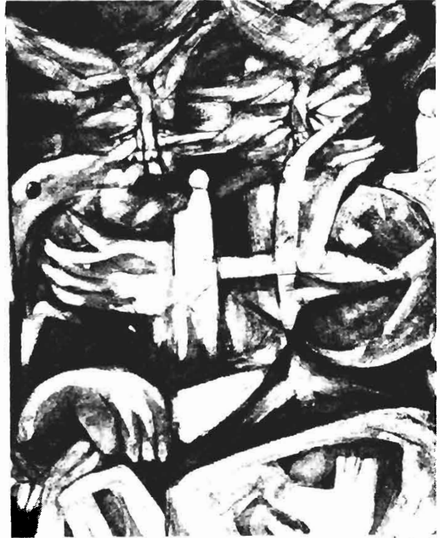
Oleo sobre tela de Dagoberto Posadas

veremos en los capítulos siguientes, y a veces también en algunas combinaciones morfosintácticas o algunos modismos normalmente identificados con el lenguaje popular. Aun los locutores de televisión, cuyas programaciones llegan a un número escasísimo de hogares hondureños, siempre en condición económica más favorecida, exhiben tendencias lingüísticas más populares que sus colegas en otros países hispanoamericanos, lo cual se puede comprobar al efectuar una comparación de los programas grabados en Honduras y los programas filmados e importados de otros países hispánicos.