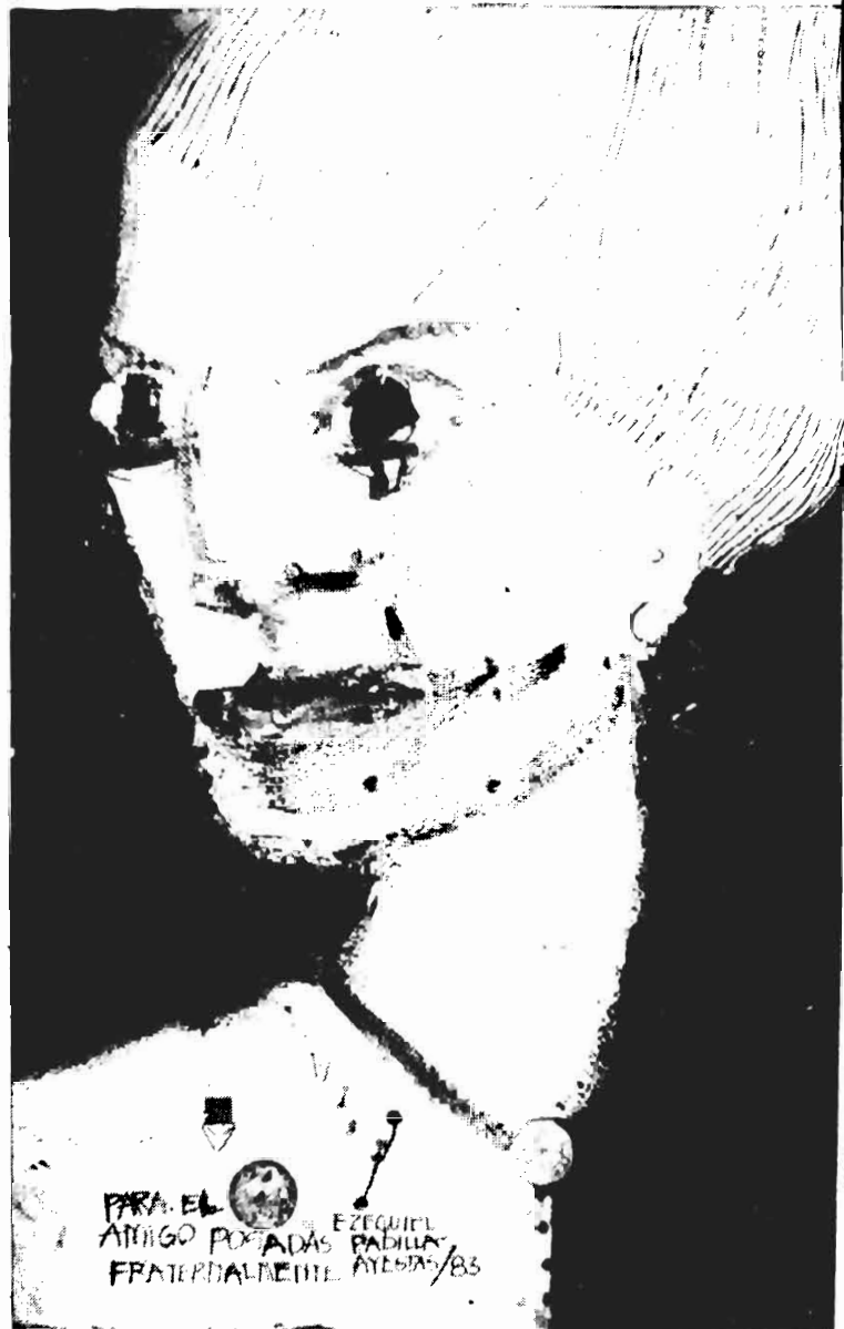
Oleo sobre masonite de Ezequiel Padilla Ayestarín